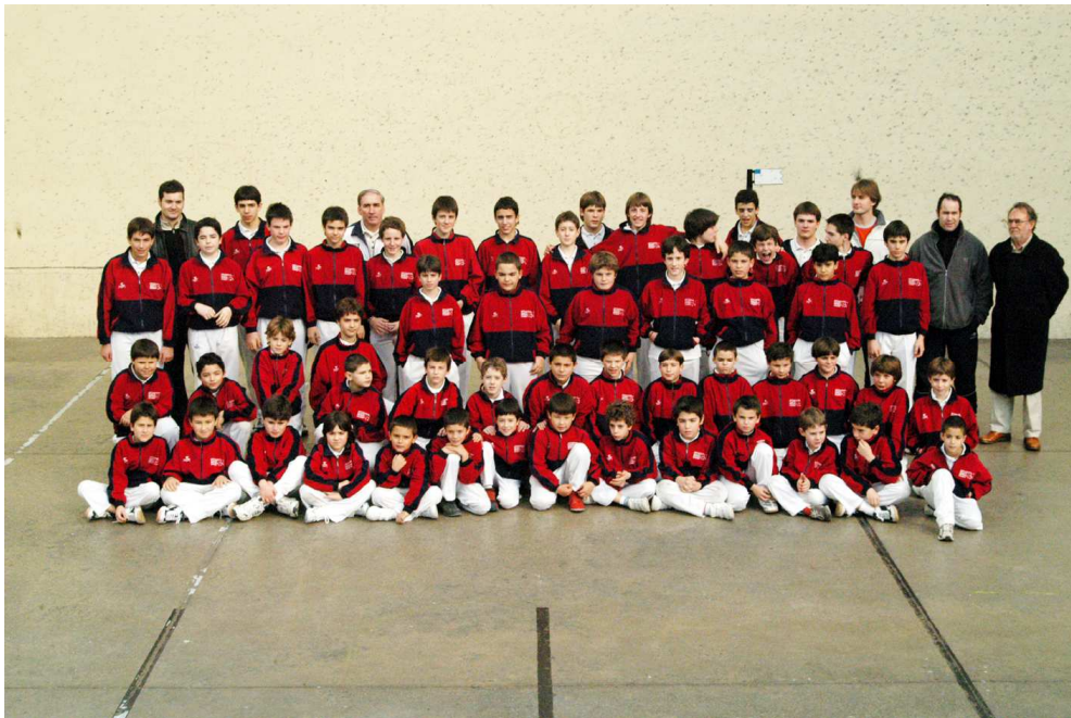
Antiguako Pilota Eskola. Promoción 2003-2004

Para entrenar a este importante número de pelotaris y teniendo en cuenta la precaria situación de frontones en el Antiguo, hemos tenido que repartirlos en cuatro frontones, Antiguo, Balda Corto, Balda Largo y Atano III lo cual ha requerido "montar" una importante infraestructura de transporte, por parte de los padres, desde el Antiguo hasta Anoeta.